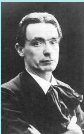
Dr. Rudolf Steiner, (1861-1925) padre dell'Antroposofia e della Biodinamica

Per ascoltare la voce dell'Omeopatia, scopri di più sul nostro sito