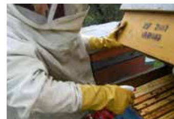
Fig. 5. Trattamento delle api mediante spruzzatura del rimedio Calcarea sulphurica 200 CH.