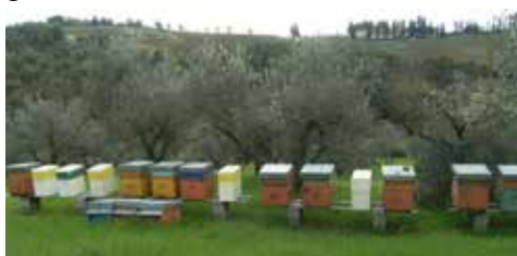
Fig. 1. Apiario sperimentale utilizzato per le prove del nostro gruppo di ricerca.

L'efficacia del rimedio è stata valutata mediante la conta delle varroe sul fondo dell'arnia. I risultati della prova non hanno dimostrato però una efficacia del rimedio nel controllo della parassitosi.