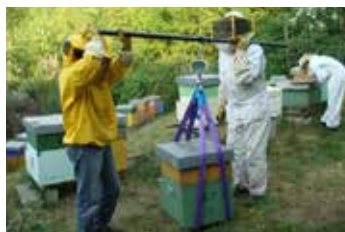
Fig. 4. Pesatura arnie al fine di determinare la produzione totale di miele.

Le api, rispetto ad altri animali, si prestano abbastanza bene, dato che è abbastanza facile trattare un numero consistente di