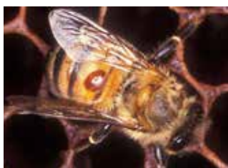
Fig. 2. Ape adulta con varroa.