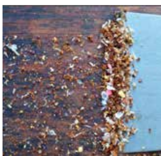
Fig. 3. Conta varroe sul fondo dell'arnia (sono rosse e di forma discoidale).

lità al freddo ed alla stagione umida (Kent J.T., 1905) ed anche in base alla letteratura (il citato lavoro di Persano Oddo e Marinelli del 2002). Inoltre Calcarea sulphurica appartiene ai cosiddetti Sali di Schuessler. Stimola il metabolismo, favorisce la coagulazione del sangue, svolge un'azione di depurazione delle mucose ed è particolarmente indicato in caso di problemi dermatologici. L'alta potenza è stata scelta per avere un effetto a più lungo termine. In ambedue le prove effettuate su gruppi di 20 famiglie, 10 trattate e 10 di controllo è stata valutata, nel tempo, la caduta delle varroe sul fondo dell'arnia. Dopo il trattamento estivo con acido ossalico (Api-Bioxal ® ) che provoca l'eliminazione delle varroe con una efficienza dell'89.4%, si è sempre riscontrato un numero significativamente inferiore di varroe sul fondo delle arnie trattate con Calcarea sulphurica 200 CH. La caduta inferiore di varroe starebbe a significare, in questo caso, una buona efficienza del rimedio omeopatico che aumenterebbe la resistenza delle famiglie, riuscendo a stabilire un ottimo equilibrio fra api e parassiti.